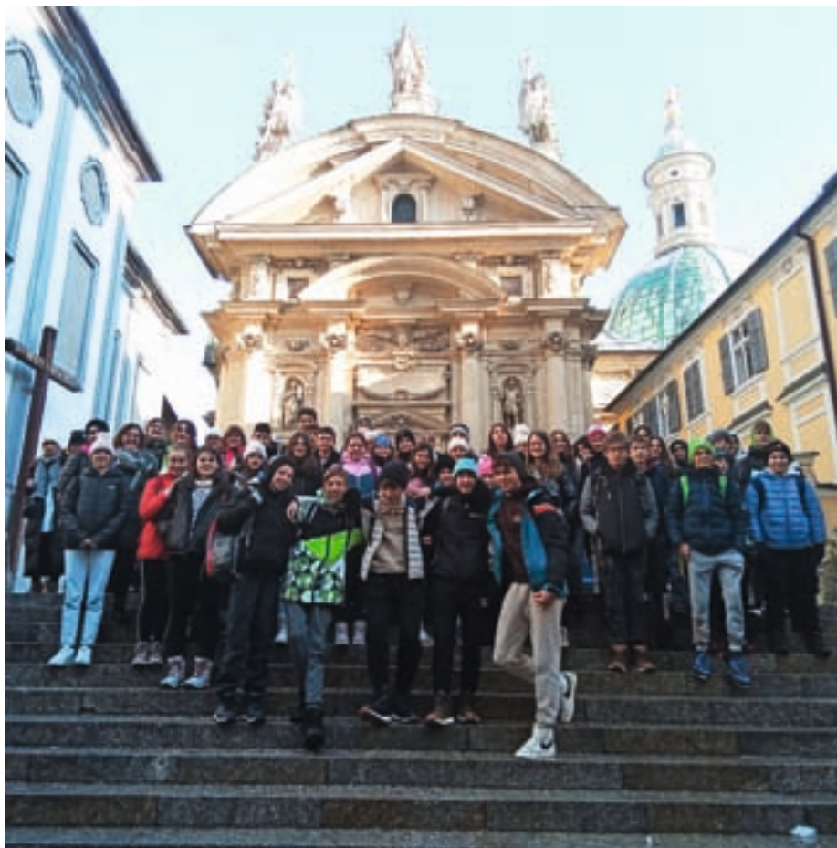
Na drugo adventno nedeljo smo z učenci spoznavali Gradec.