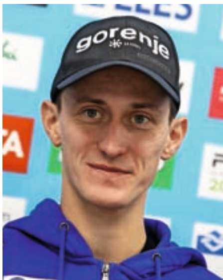
Peter Prevc bo tekmovalno pot sklenil v Planici na tradicionalnem finalu svetovnega pokala med 21. in 24. marcem.