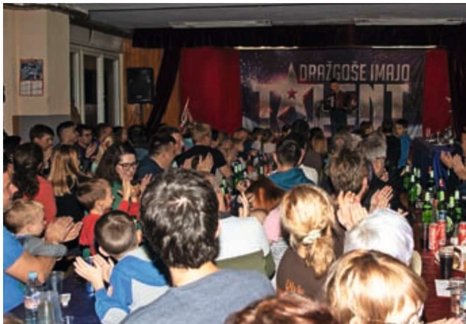
Vaška dvorana je pokala po šivih.