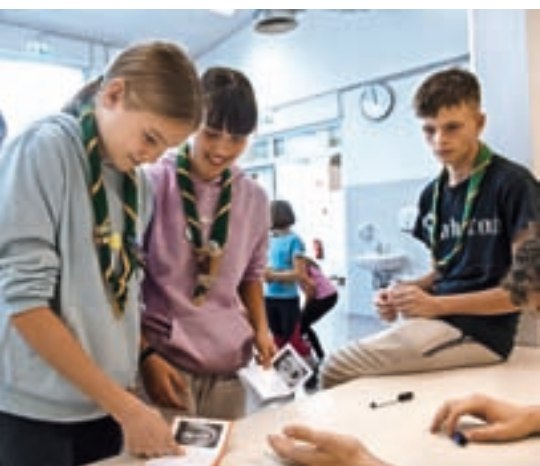
Jesenovanje v Smledniku

cu oktobru. Na Soriško planino je prišlo več kot 160 zagreth tekmovalcev, združenih v 28 ekip. Vsi so prišli z enim ciljem – preživeti krasen dan v krogu najbližjih na občinskem orientacijskem tekmovanju. Prav prisrčno se zahvaljujemo vsem sodelujočim in upamo, da se tudi letos jeseni vidimo v tako velikem številu.