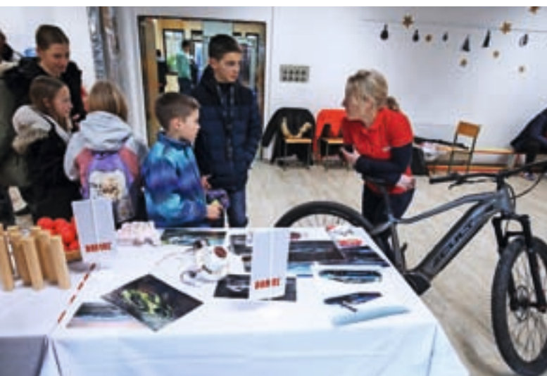
Domelovo električno kolo, robot za palačinke in še mnoge druge aparature so vzbudile zanimanje osnovnošolcev.