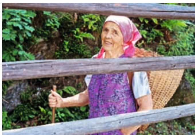
S košem pri kozolcu