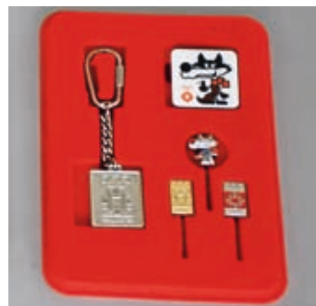
Set spominkov