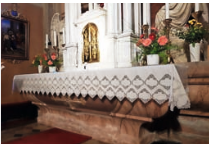
Največ čipk so všili v prt za glavni oltar, ki je velik več kot štiri metre.