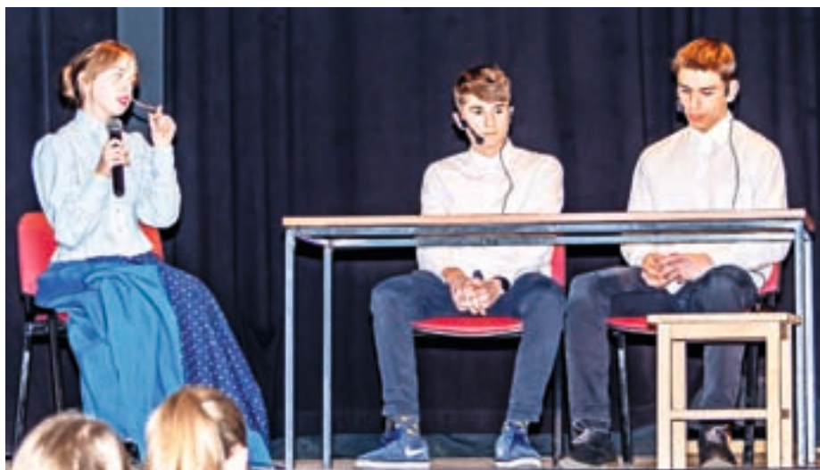
Skozi Prešernovo življenje so obiskovalce popeljali učenke in učenci Osnovne šole Železniki.