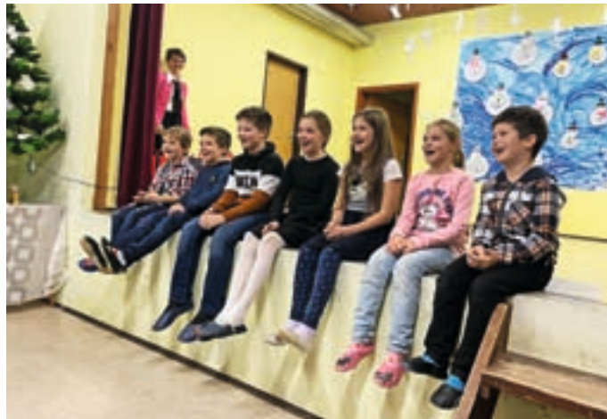
Učenci in učiteljice so pripravili pester program.