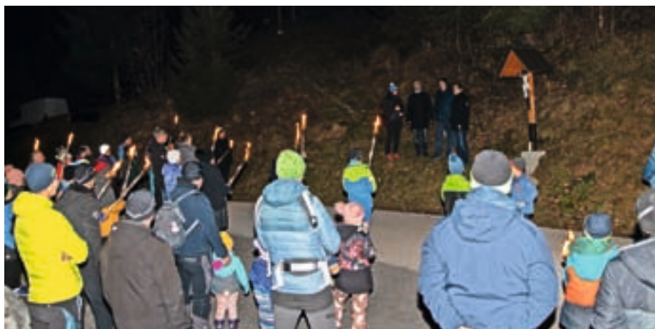
Z lučko k Lučki

ja in družina je obnemela. Kot bi se ob prošnji, naj sveta Lucija varuje in brani dom vsem Dražgošanom, ustavil čas. Ob ognju in soju ugašajočih bakel je sledila manjša pogostitev z zaseko, namažano na domačem kruhu, s kuhanim vinom, čajem in vročo čokolado.