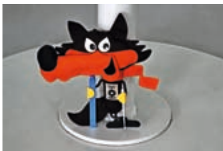
Maskota Vučko