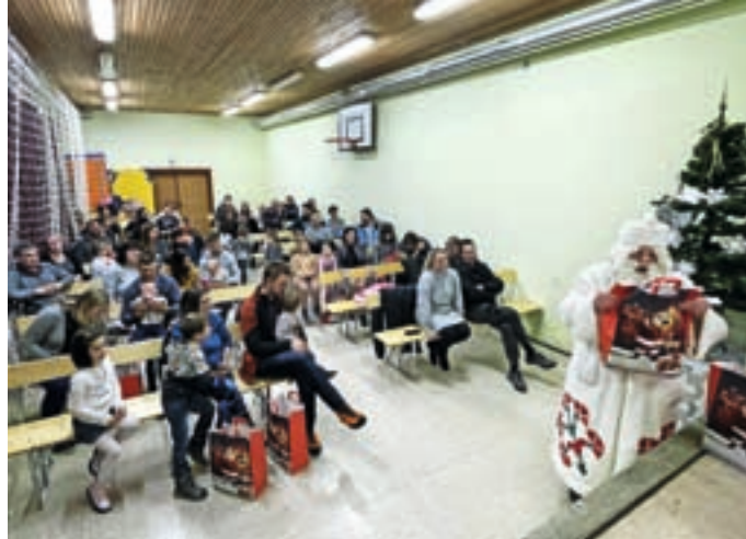
V Davči Dedek Mraz obdaruje otroke do vključno petega razreda. Tokrat jih je bilo 42.