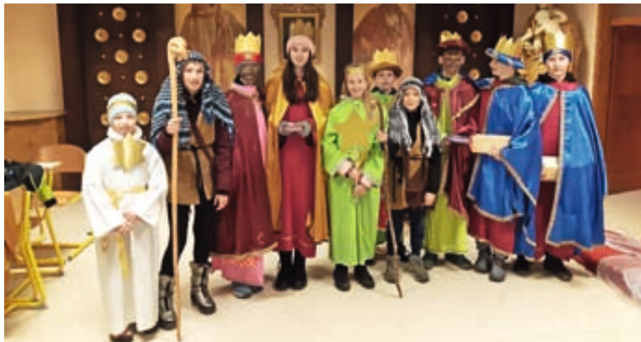
Na praznik Gospodovega razglasenja, 6. januarja, so po Dražgošah hodili koledniki.

V Zborniku Selške doline Železne niti št. 20 sem v članku Dražgoški zidani kozolci na strani 333 pomotoma zamenjal ledinski imeni starih zidanih objektov, ki stojita na parceli št. 876 v katastrski občini Dražgoše. Pajštva stoji na kraju z ledinskim imenom Zadnja njiva, zidani kozolec s petimi okni pa Na vrt, in ne obratno, kot je napačno navedeno v zborniku. Oba objekta sta v lasti Hkavščeve domačije. Za napako se iskreno opravičujem. Rok Pintar