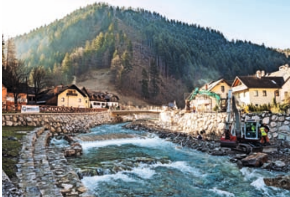
Prva faza protipoplavne zaščite Železnikov gre proti koncu. Novo podobo dobiva tudi območje Dermotovega jezua, kjer poteka še gradnja obvoznice.

Poleg krajših odsekov bomo asfaltirali skoraj kilometer dolg odsek od Košana do Mrovlja in javno pot Pogorišar v Davči. Nekaterih odsekov se bomo lotili tudi v sklopu sanacije po lanskih poplavah, s pomočjo sredstev, ki nam jih je s predplačili na podlagi prijavljene škode namenila država. Del jih bomo prerazpo-