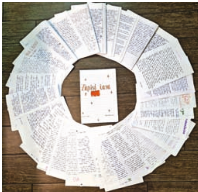
Rokopisi učencev predmetne stopnje

Učenci od 2. do 5. razreda na centralni šoli in vseh štirih podružnicah so zato pisali razredne dnevnike. Vsak dan je bil v razredu določen učenec, ki je opisal dopoldansko dogajanje v razredu – kaj so se tisti dan novega naučili, so pisali kakšen test, jih je kdo obiskal, kaj je bilo za malico, se je kaj hecnega pripetilo ... Na koncu dnevniških zapisov so se podpisali in jih popestrili z ilustracijami. Že ob hitrem pregledu zapisov so učenci ugotovi-