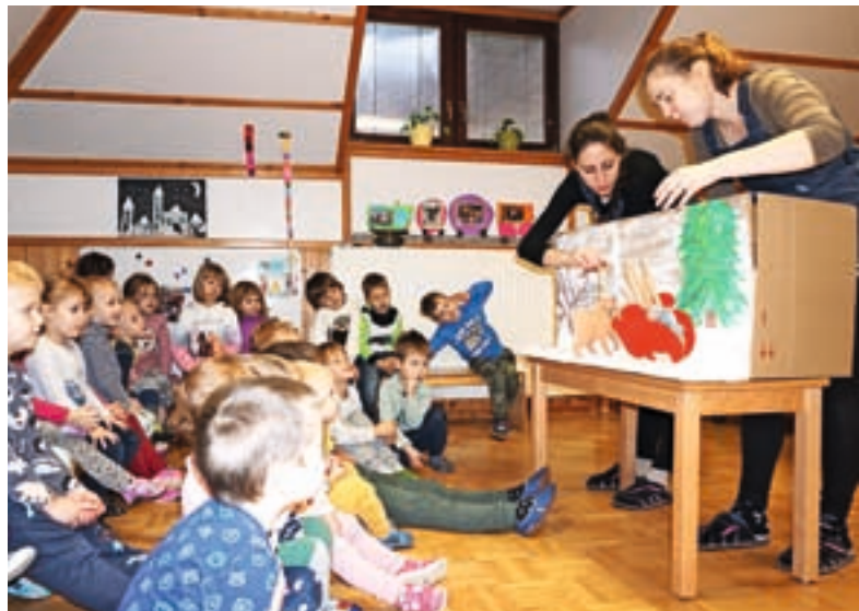
Utrinek z ure pravljic v Antonovem vrtcu

Otroci so prisluhnili različnim pravljicam. Spoznali so pravljico Hvaležni medved, ki sva jo uprizorili z gledališčem kamišibaj. V mesecu decembru so prisluhnili glasbeni pravljici Mojca Pokrajculja. V januarju, takoj po praznikih, pa sva otrokom pripravili lutkovno predstavo Rokavička. V mesecu februarju smo se videli tik pred Prešernovim dnevom, zato je