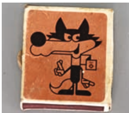
Vžigalice s podobo Vučka

Najbrž ena najbolj prepoznavnih športnih maskot je Vučko, volček z olimpijskih iger v Sarajevu. Njen avtor je akademski slikar Jože Trobec. Še po 40 letih