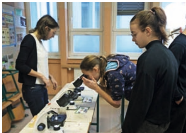
Učence so pritegnile tako predstavitve srednjih šol in njihovih programov kot tudi nadaljnje možnosti zaposlitve, o katerih so izvedeli pri posameznih podjetjih.