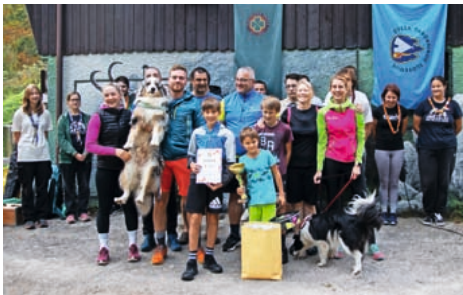
Z orientacije na Soriški planini, kjer se je zbralo več kot 160 zagreth tekmovalcev

Še ena super orientacija pa je potekala tudi na drugo sončno nedeljo v mese-