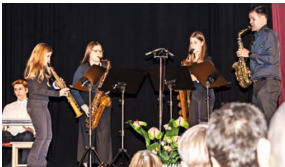
Proslavo so z glasbo obogatile učenke Glasbene šole Škofja Loka pod mentorstvom profesorjev.