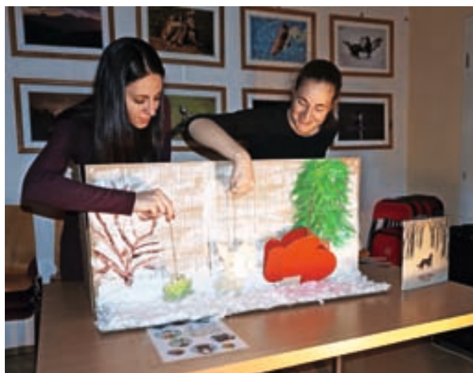
Ura pravljic v knjižnici