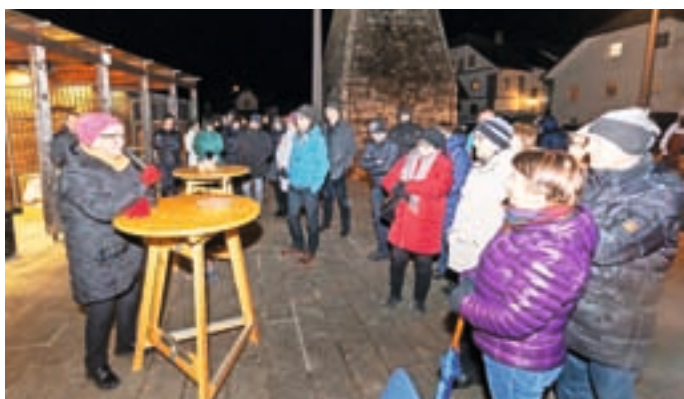
Muzejsko društvo Železniki je na Prešernov dan znova priredilo dogodek Pred plavžem mi pesem povej.